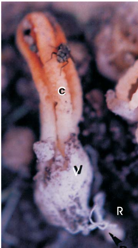
Fig. 2. Basidioma de Laternea dringii C=columnas del basidioma; V= volva;; R=rizomorfos..

El tamaño del basidioma es otro caracter distintivo, es de 1.3 a 1.5 mm. de altura, por 4 a 5 mm. de ancho y de color rojo-anaranjado a amarillento-anaranjado. Está formado por 3 a 4 columnas unidas en el ápice formando un brazo transversal (fig. 1, B) y las columnas son libres en la base (fig. 2 y 3).