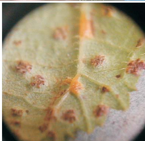
Fig. 1. Puccinia hiascens A. Lesiones vistas desde el haz de la hoja. B. Telios.