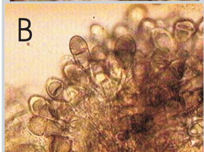
Fig.2. A. Teliospora; B. Telio de Puccinia hiascens 1000X.

Poros germinativos 2, uno de posición apical y el otro en la célula inferior cerca del septo (Fig. 3 B).