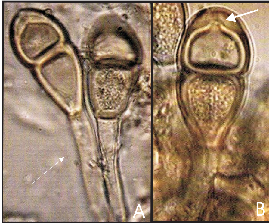
Fig.3. Teliosporas de Puccinia hiascens 1000X A. Teliospora pedicelada (flecha); B. Teliospora con poro germinativo (flecha)..

Se conoce de Puebla y Veracruz (Leon-Gallegos, 1981) y fue registrada de la zona de Chiconquiaco (Galvan 1983); tambien se conoce de Chiapas y Guatemala (Hennen y Cummins 1973).