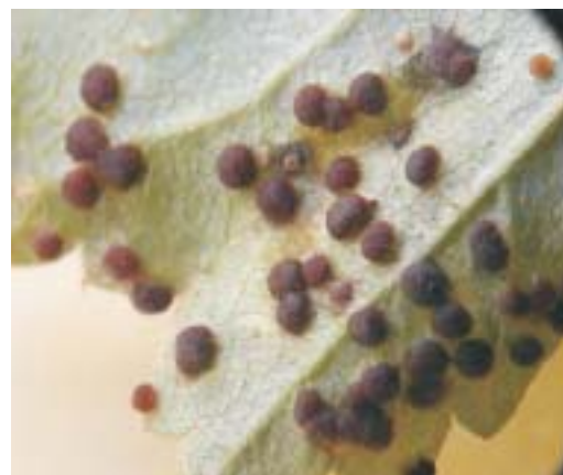
Fig. 3. Teliosoros de Puccinia malvacearum , errumpiendo la epidermis de la hoja de Malva.