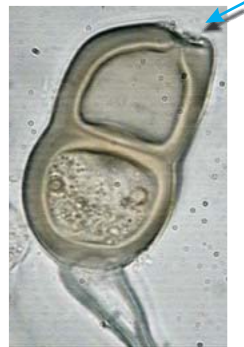
Fig. 6. Teliospora de Puccinia malvacearum , notese el poro germinativo (flecha) en el ápice de la espóra y el pedicelo incoloro en la base.