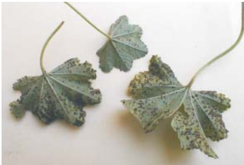
Fig. 1. Plantas de Malva infectadas con Puccinia malvacearum , notese la gran cantidad de pústulas (Teliosoros).

De color café amarillento claro a café oscuro casi negro en la madurez (Fig. 5).