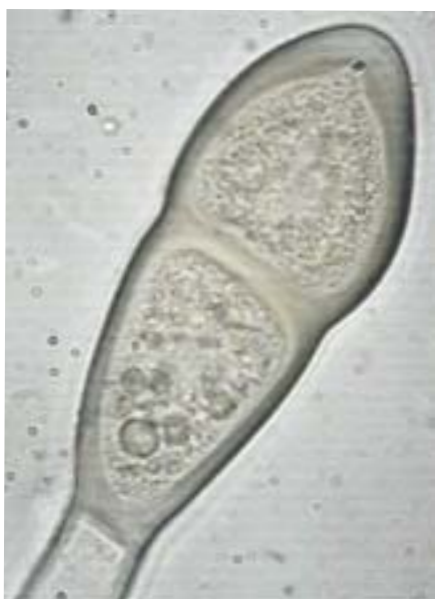
Fig. 2. Teliospora de Puccinia malvacearum , notese parte del pedicelo en la base.

Teliosporas biceluladas (unas cuantas son unicelulares), de pared gruesa, elipsoides, fusiformes, con ápice agudo, pediceladas, pedicelos incoloros y mas o menos largos y con un septo en cada extremo. (Figs. 2, 4 y 6).