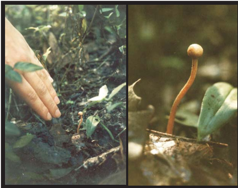
Fig.3. Ascomas de Cordyceps entomorrhiza en su habitat natural.