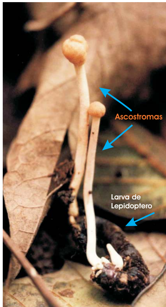
Fig. 1. Ascomas de Cordyceps entomorrhiza sobre larva de Lepidoptero, en su habitat natural. Notese que los ascomas emergen de ambos extremos del cuerpo de la larva.

Ascas cilíndricas delgadas y alargadas, con un aparato ascual en el apice, ascas filiformes, multiseptadas o multicelulares, de 475-535 x 1-1.5 micras que se rompen en fragmentos de 7-11 x 1-1.5 micras.