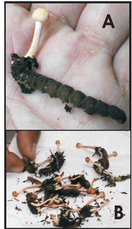
Fig.4. A. Ascoma de Cordyceps entomorrhiza sobre larva de Lepidoptero. B. Colecta de ascomas.