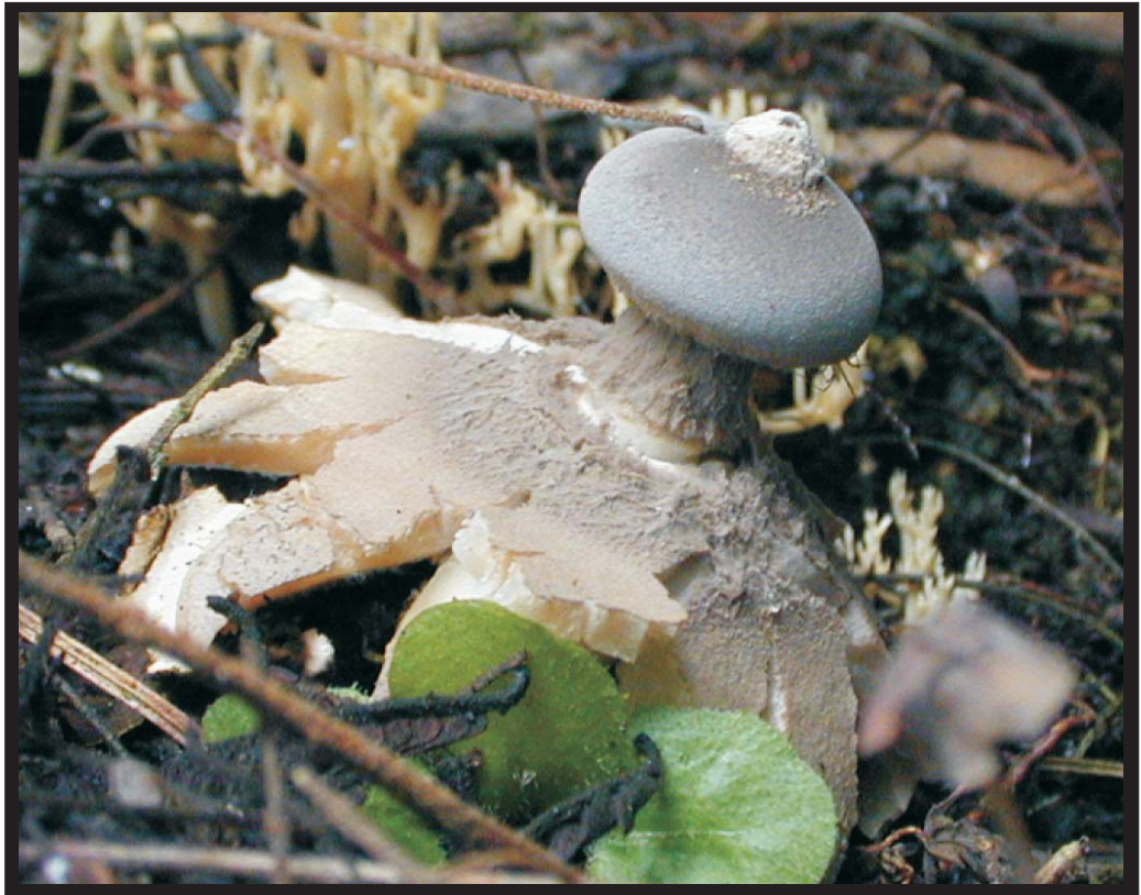
Fig. 1. Basidioma de Geastrum pectinatum en su habitat natural.

Por: Armando López R. y Juventino García A. Instituto de Genética Forestal, Universidad Veracruzana e-mail: armlopez@uv.mx