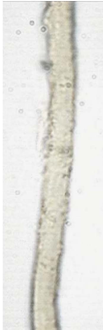
Fig. 4. Capilicio macizo X1000.