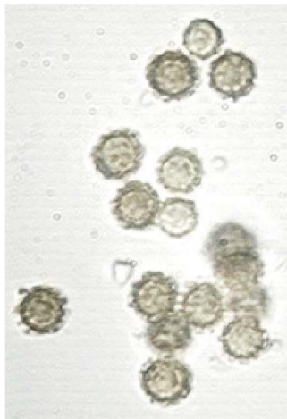
Fig. 5. Esporas verrugosas X1000.

Xalapa, Ver. Septiembre 12, 2002, López y García, Parque Ecológico El Haya, sobre el mantillo de Mimosa scabrella en jardín.