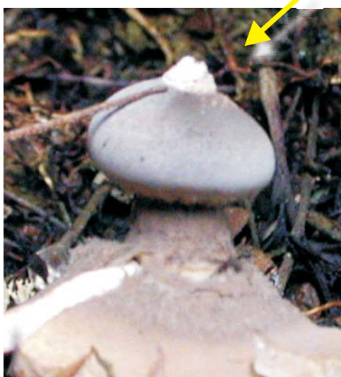
Fig. 3. Peristoma blanquecino (flecha), poco delimitado y sin estrias.

Esporas finamente verrugosas, café claro al microscopio, globosas, de 4 a 5 micras; el peridio es macizo y casi liso, no ramificado, de 2.5 a 6 micras.