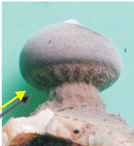
Fig. 2. Parte basal del saco esporífero pectinada (flecha).