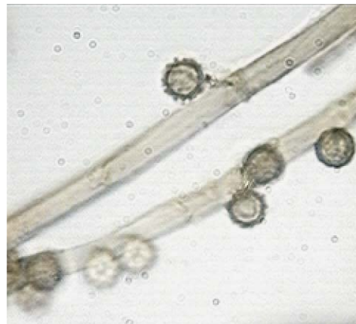
Fig. 6. Esporas y capilicio X1000.

Pérez-Silva, E., Herrera, T. Y M. Esqueda-Valle. 1999. Species of Geastrum (Basidiomycotina: Geastraceae) from Mexico. Revista Mexicana de Micología 15:89-104.